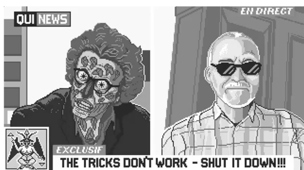
Graphique 4. Mème attaché au telegrampost [7]

[7] Ben c'est la petite communauté que vous connaissez bien. (LVC, le 18.11.21)