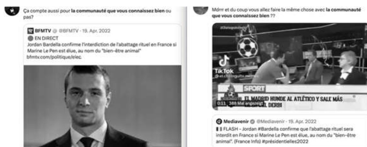
Graphique 6. Les tweets du 19 avril 2022 sur les propos de Jordan Bardella

En avril 2022, les commentaires sur la communauté que vous connaissez bien se multiplient. Malgré le fait qu'il y ait des messages faisant référence au premier tour des élections présidentielles (p. ex. sur les résultats du vote des bureaux en Israël ou le financement de la campagne électorale de Zemmour), le jour le plus productif en avril 2022 est le 19. Deux sujets reviennent : une supposée interdiction de l'abattage rituel en France (le mois d'avril coïncide avec le Ramadan en 2022) par Marine Le Pen liée à la campagne électorale et un deuxième sujet concernant la politique sportive du FC Barcelone.