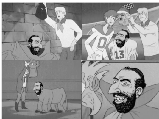
Graphique 5. Captures du gif pris des séquences de Scooby Doo

Nous retrouvons dans les messages verbaux, mais également dans les technographismes, les préjugés attribués aux Juifs depuis des siècles qui ont été repérés entre autres chez Schwarz-Friesel et Reinharz (2017) et Sarfati (1999). Des concepts comme l' hérésie , l' image du Juif cruel , le lobbyisme juif ou des théories complotistes plus holistes comme le great reset , donc l'installation d'un nouvel ordre mondial par les Juifs , sont implicites dans le groupe nominal la communauté que vous connaissez bien , comme dans le lexème juif . Prenant en compte l'effet de la supériorité des images ( picture-superiority effect ) selon lequel le cerveau humain peut enregistrer l'information de l'image plus facilement que celle du texte (p. ex. McBride et Doshier, 2002; Whitehouse, Maybery et Durkin, 2006) les gifs et mèmes gagnent de l'importance. Ils nourrissent le sens transmis par des énoncés tout en reliant mots et images et significations originales et références (pop)-culturelles.