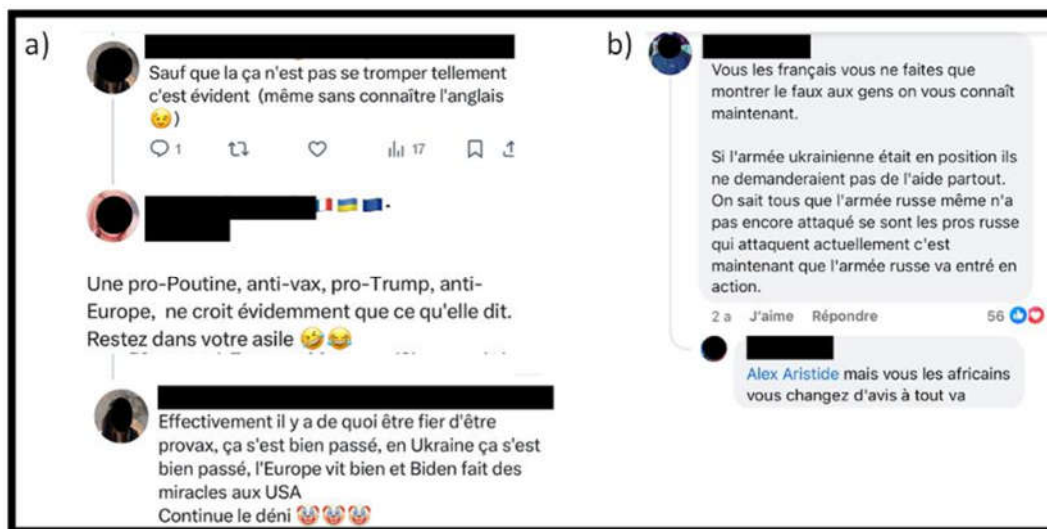
Figure 3. Catégorisation d'autrui dans le cyberspace

centre de désaccords étant des moteurs de montée en tension et de production de haine. Elles sont renforcées par d'autres éléments discursifs que nous aborderons plus loin.