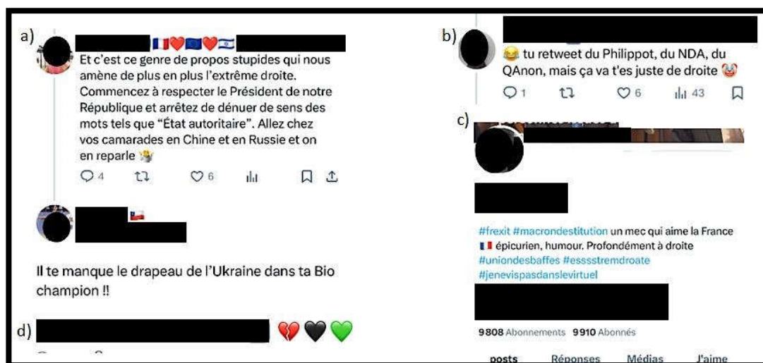
Figure 2. Moyens de présentation de soi dans l'écosystème numérique

Les interactions sont comme des espaces de construction de la cohésion des identités qui est un processus dialogique. Dans l'écosystème numériques, les interlocuteurs sont en négociation identitaire constante, mais aussi en recherche d'une cohérence identitaire dans les productions d'autrui (ce que l'on observe notamment dans les exemples B et C ci-dessus).